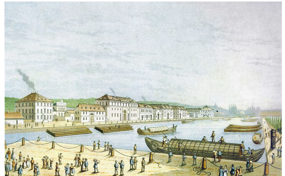
Le bassin dans les années 1850

Le quartier de la gare est un espace urbain en constante mutation, il cristallise les attraits autour des moyens de transport: tout d'abord la voie d'eau puis le rail et la multimodalité avec tramways, vélos et autobus.