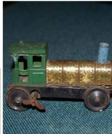
Train des années 1930-1935