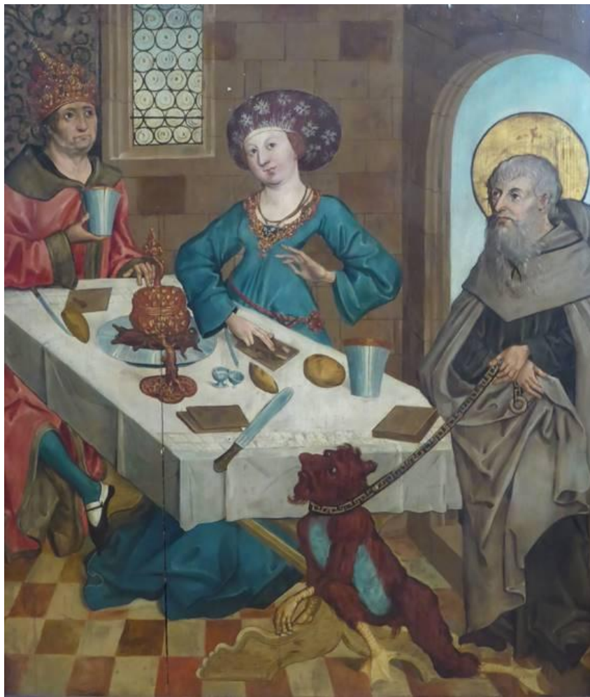
ANONYME, Alsace, 15ème siècle - Episode de la vie de Saint André

Il s'agit d'une huile sur bois d'une hauteur de 1m05 et d'une largeur de 90 cm.