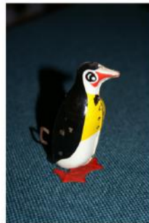
Jouet mécanique : pingouin se dandinant, en métal peint, vers 1935