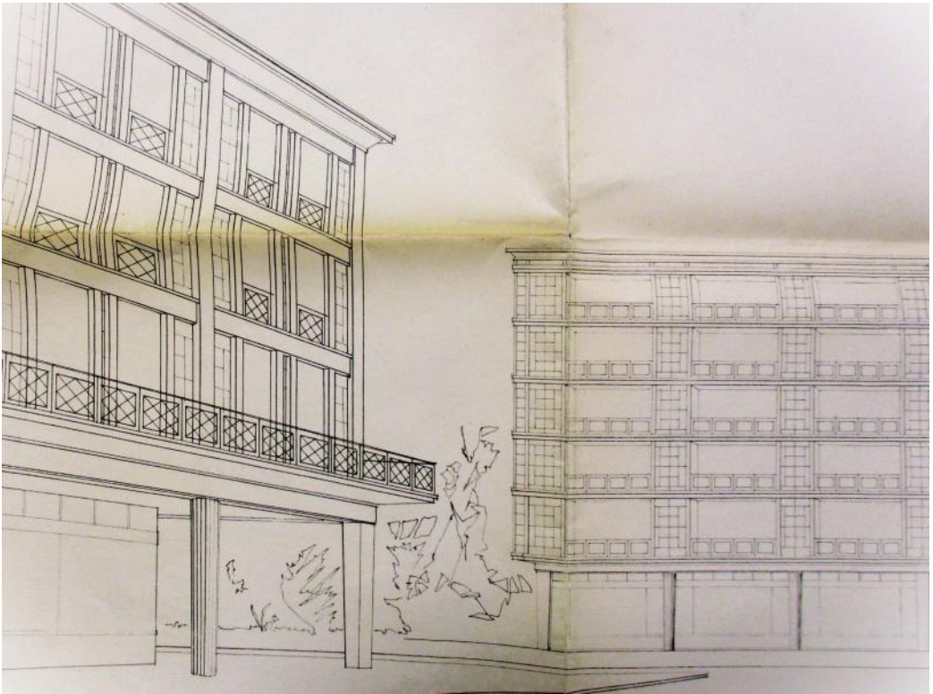
Vue en perspective du projet de carrefour de Bâle (détail), architectes Pierre Lauga et Daniel Girardet (document AMM 29W2)

À l'exception de celles de la rue du Sauvage, toutes les constructions de la fin des années 1940 sont encore bâties de façon traditionnelle, le plus souvent par de petites entreprises. Rue du Sauvage, des procédés plus innovants sont utilisés pour les deux premiers « blocs » reconstruits : béton, préfabrication, composants normalisés, etc.