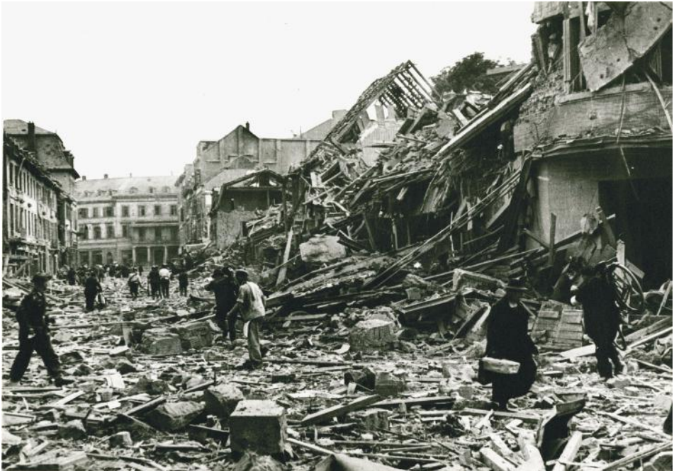
L'ancien Cercle social, rue de Bâle (actuellement avenue du Maréchal de Lattre de Tassigny), en 1944

Parmi les édifices détruits : la Banque de France rue du Sauvage (architecte Paul Marozeau, en 1922), la Poste centrale (de 1895), l'immeuble de l'ancien Cercle Social (du début du XIX e ), la Banque populaire d'Alsace rue Wilson (architecte Albert Speer 4 , de Mannheim, en 1912), plusieurs des bâtiments de la place de la Bourse et une partie de l'hôtel de la Société industrielle, la tuilerie Lesage rue Josué Hofer, la filature Gluck rue Lavoisier, l'usine à gaz rue de l'Ill, la grande distillerie Cusenier rue du Parc, la brasserie de la Paix avenue Salengro, deux pavillons de l'hôpital, une partie de la cité ouvrière de la Société immobilière Mulhouse Nord (réalisée de 1925 à 1931 par les architectes Joseph Bassompierre, Paul de Rutté et Paul Sirvin) 5 . Outre les destructions immobilières, plusieurs usines de Mulhouse et de sa région, reconverties en usines de guerre ou dont le matériel a disparu, sont à l'arrêt 6 .