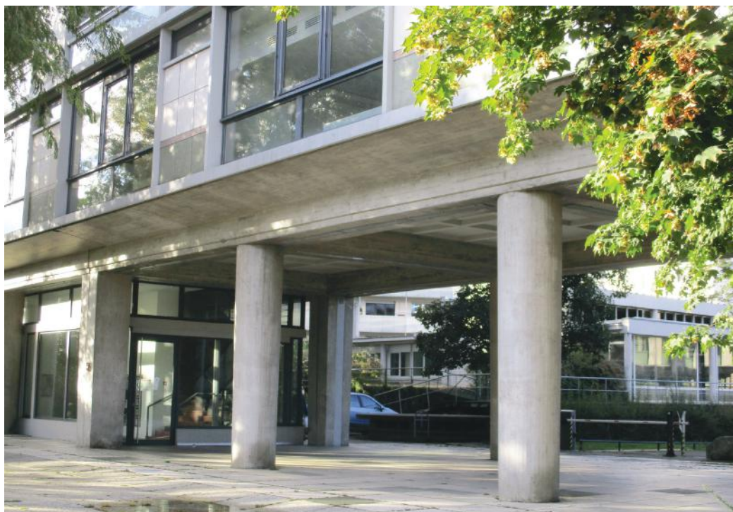
Façade de l'immeuble Ecran (détail), architecte Daniel Girardet