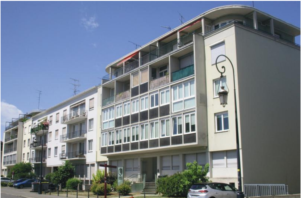
Immeubles reconstruits du front de gare, architecte François Spoerry

À la Porte de Bâle, Pierre Lauga implante les bâtiments autour du nouveau carrefour selon une composition orthogonale symétrique classique s'ouvrant sur la modernité de l'immeuble Écran et sur l'espace piétons rejoignant le parc Salvator, tout en se raccordant aux constructions édifiées le long des rues de Lattre de Tassigny et des Bonnes-Gens.