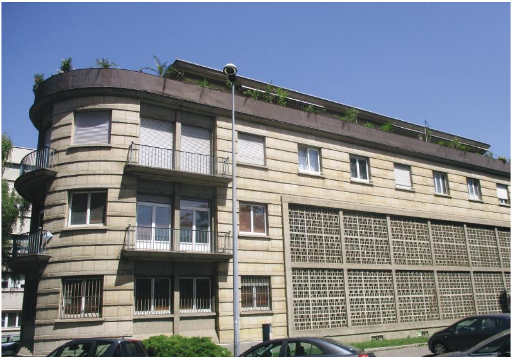
Bâtiment du Comptoir national d'Escompte de Paris, architectes Pierre Jean Guth et Jean Clabaux

Quelques petits immeubles sont intéressants pour leur inscription discrète dans leur environnement tout en affichant des traits de modernité: rue de Lattre de Tassigny (architectes Paul Kirchacker Fils et Henri Perrin), rue Salvator (Paul Claudel), rue de Bruebach (François Sperry).