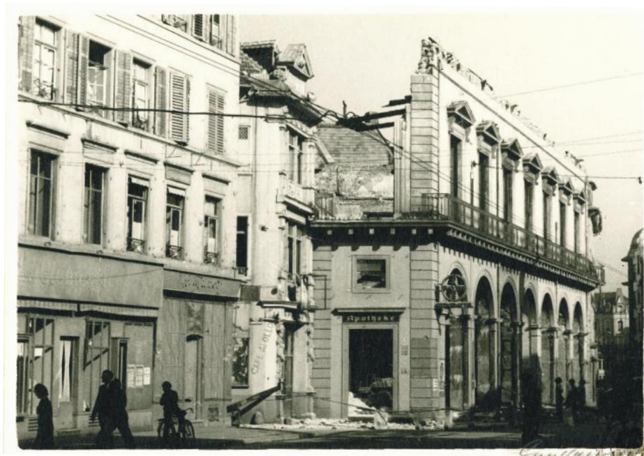
La rue de Bâle, actuelle avenue du Maréchal de Lattre de Tassigny, en 1944