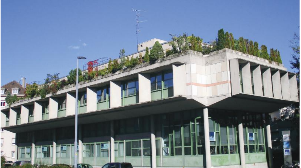
Atelier de mécanographie d'EDF, rue du Parc, architecte Daniel Girardet

À la Porte de Bâle, Pierre Lauga implante les bâtiments autour du nouveau carrefour selon une composition orthogonale symétrique classique s'ouvrant sur la modernité de l'immeuble Écran et sur l'espace piétons rejoignant le parc Salvator, tout en se raccordant aux constructions édifiées le long des rues de Lattre de Tassigny et des Bonnes-Gens.