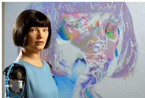
Ai-Da est une gynoïde achevée en 2019 posant à côté d'une de ses créations

Art de Haute-Alsace 12, passage des Augustins 68100 MULHOUSE